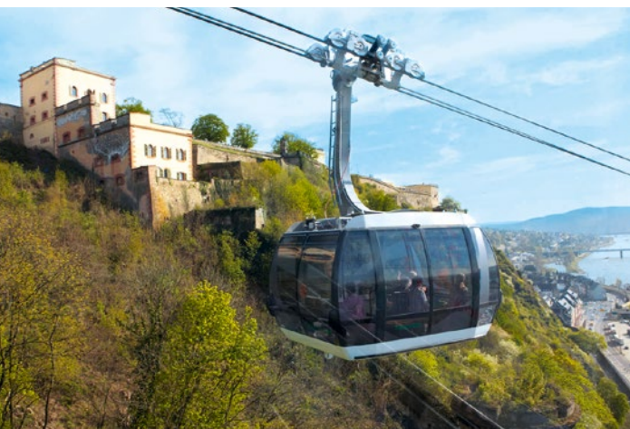
Подвесная канатная дорога в Кобленце