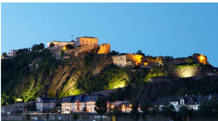
Культурный центр «Крепость Эренбрайтштайн» | Краеведческий музей города Кобленца