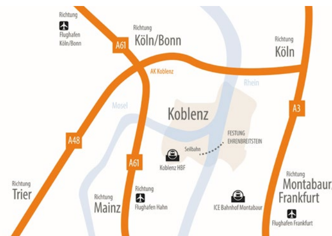
Как нас найти

Провизию для Вашего тура по взятию крепости Вы найдёте в киоске или в живописной пивной под открытым небом Кобленца. Сказочный вид и прусская кухня в современном исполнении ожидают Вас в крепостном ресторане-кафетерии «Кафе Хан» (Café Hahn, Петух).