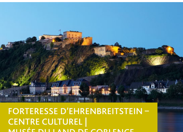
FORTERESSE D'EHRENBREITSTEIN – CENTRE CULTUREL | MUSÉE DU LAND DE COBLENCE